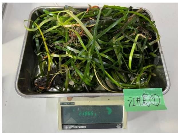
(a) 湿質量（江井島海岸①）