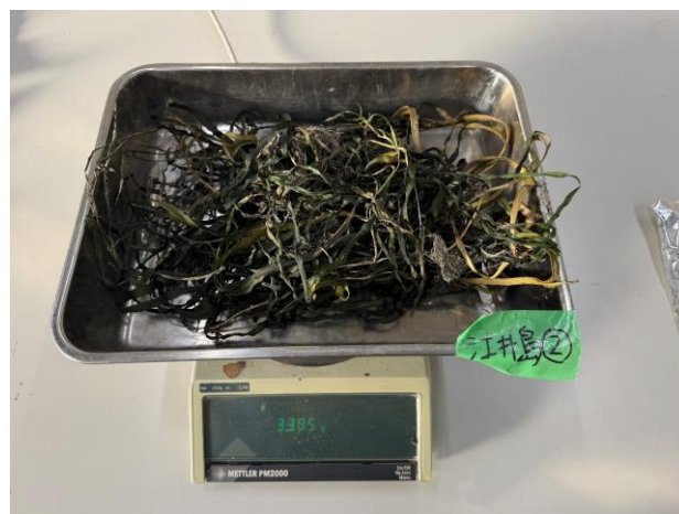
(d) 乾燥質量（江井島海岸②）