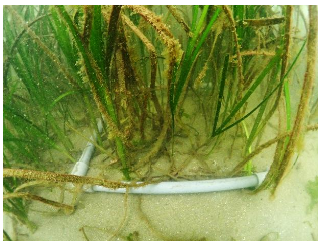
(a) アマモのサンプリング (1ヶ所目)