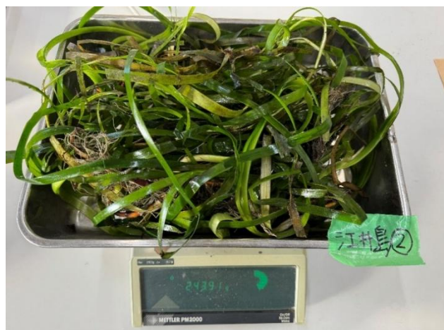
(b) 湿質量（江井島海岸②）