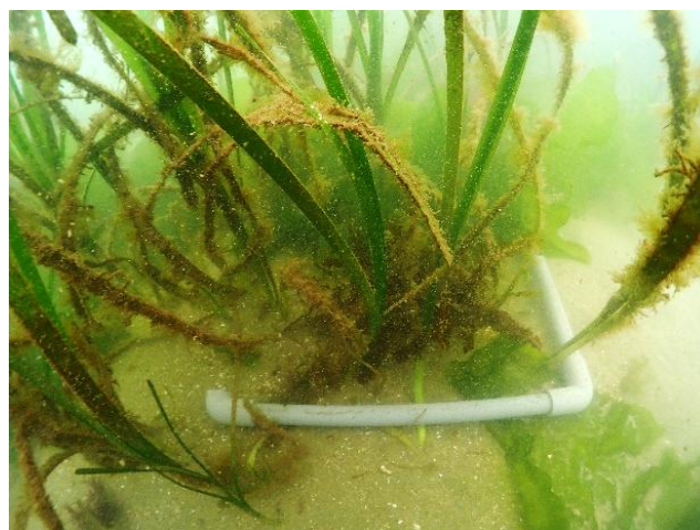
(b) アマモのサンプリング (2ヶ所目)