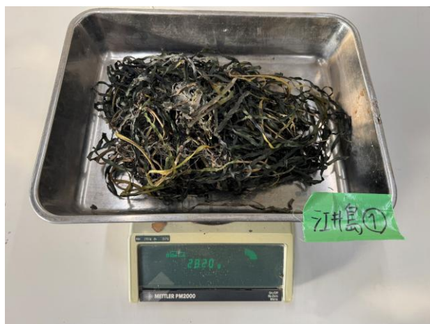
(c) 乾燥質量（江井島海岸①）